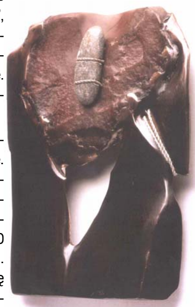
Z cyklu: „Dante Europejczyk” brąz patynowany, technika mieszana

w zbiorach British Museum w Londynie, Muzeum Dantego w Rawennie, Muzeum Sportu w Lozannie, Muzeum Toyamura w Japonii oraz w wielu kolekcjach prywatnych na całym świecie. (al)