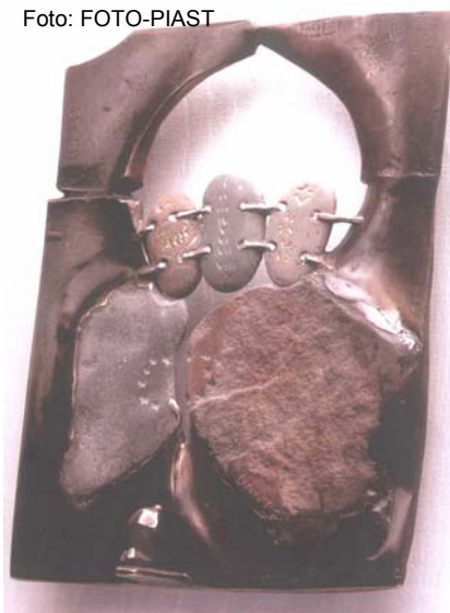
Z cyklu: „Dante Europejczyk” brąz patynowany, technika mieszana